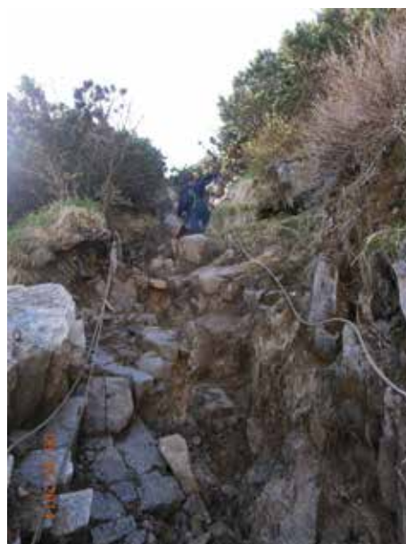
ロープを張ったが、不安定な状態