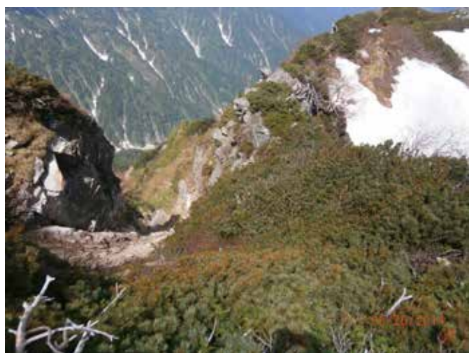
崩落箇所上からの眺め