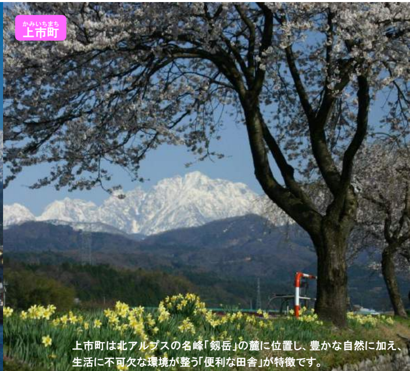
かみいちまち 上市町

上市町は北アルプスの名峰「剱岳」の麓に位置し、豊かな自然に加え、生活に不可欠な環境が整う「便利な田舎」が特徴です。